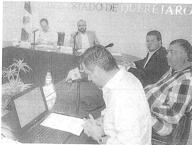
EL IEEQ cumplió en tiempo con la implementación de los Lineamientos del Sistema Nacional de Acceso a la Información Pública.

Además, reportó que en el mismo periodo se tuvieron 74 mil 906 visitas