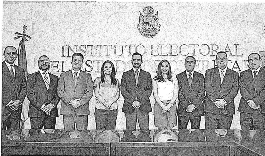
AÚN SIN ciudadanos interesados en contender dentro de los comicios 2017-2018.

"Dentro de las cuales se conocen las elecciones, en el ámbito de su competencia e incluso, entregan las constancias de registro a quienes resultan ganadores de los Distritos y de los Ayuntamientos... evidentemente están integrados por personal técnico y por cinco consejeros o consejeros ciudadanos, que atendieron a la convocatoria que está ahorita en desarrollo, para integrar esas 27 oficinas", finalizó.