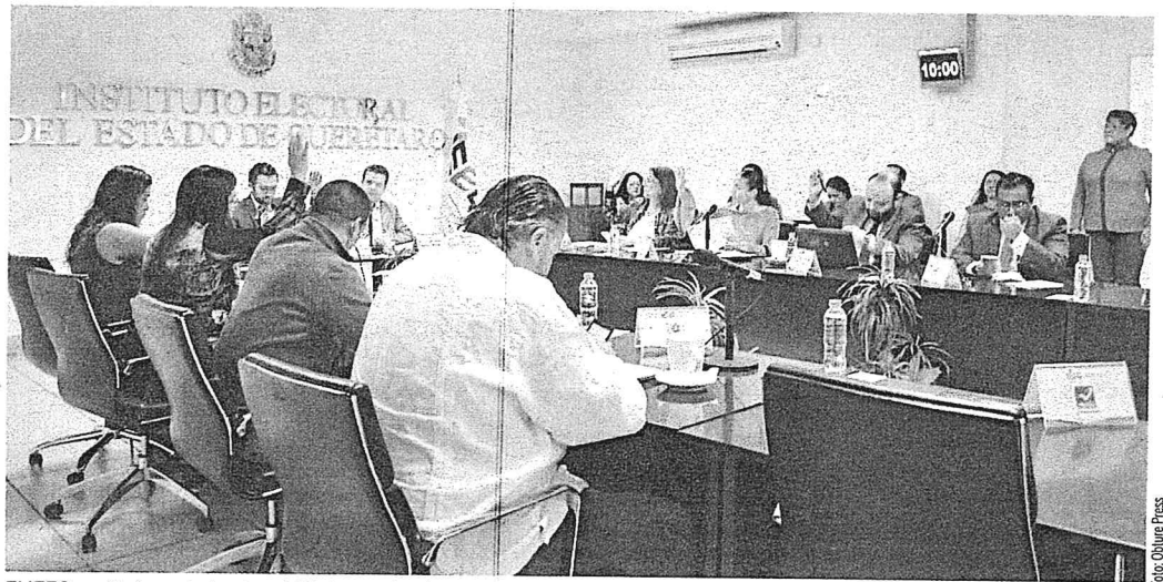
El IEEQ emitirá a más tardar el 23 de octubre la resolución de quienes aspiran a participar bajo esta figura.

A más tardar el 23 de octubre de 2017, el Consejo General emitirá las resoluciones relativas a la procedencia o improcedencia del registro