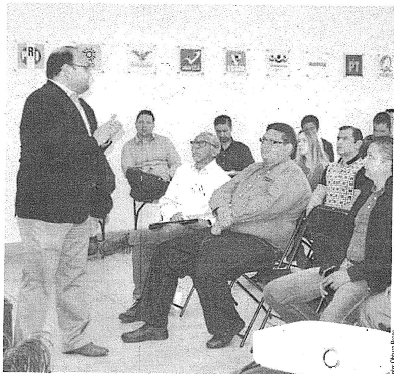
El instituto electoral estudia una posible sanción al candidato independiente.