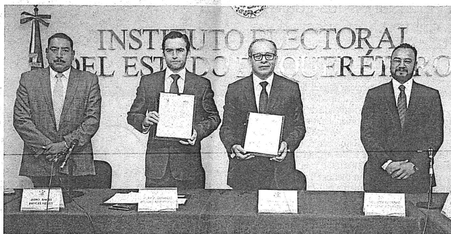
Con el convenio los agentes de seguridad se convierten en auxiliares que apoyarán a la autoridad electoral.

“Con esta firma del convenio logramos dos propósitos específicos con responsabilidades diferentes. El primero es garantizar a la ciudadanía que el 1 de julio podrán salir a votar con absoluta seguridad,