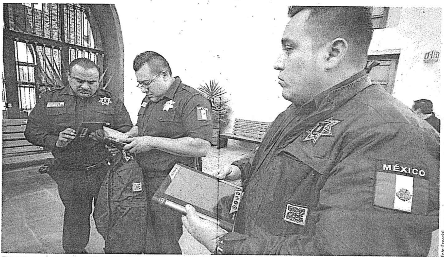
El instituto electoral local firmó un convenio de colaboración con la policía estatal y municipales.

El objetivo es darle certeza a la población del estado que su voto será contado con total transparencia