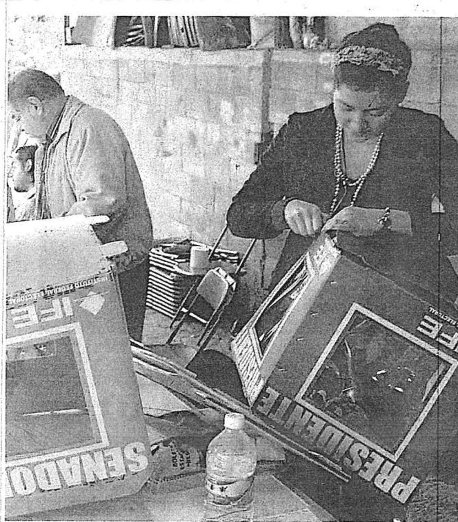
La oferta de candidatos en SJR no tendrá muchas caras nuevas, pues PAN y PRI tienen como abanderados a los mismos personajes de hace tres años.