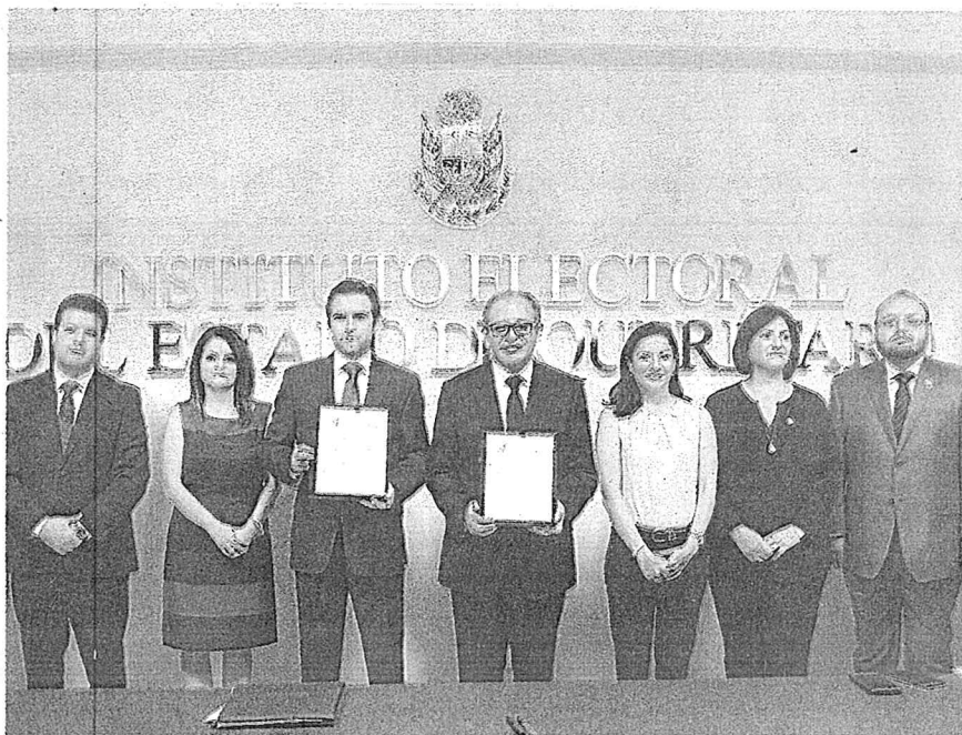
FIRMA EL IEEQ y gobierno del estado convenio de seguridad