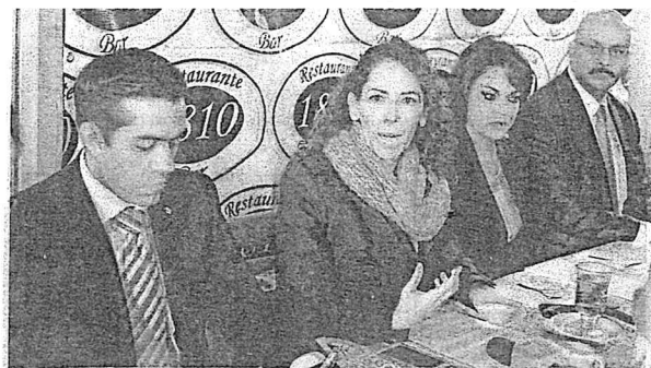
Hay 60 observadores electorales registrados para hacer presencia el 1 de julio.

La presidenta del observatorio recordó que tienen 60 observadores electorales registrados, con quienes trabajará esta semana para armar la ruta crítica de las ca-