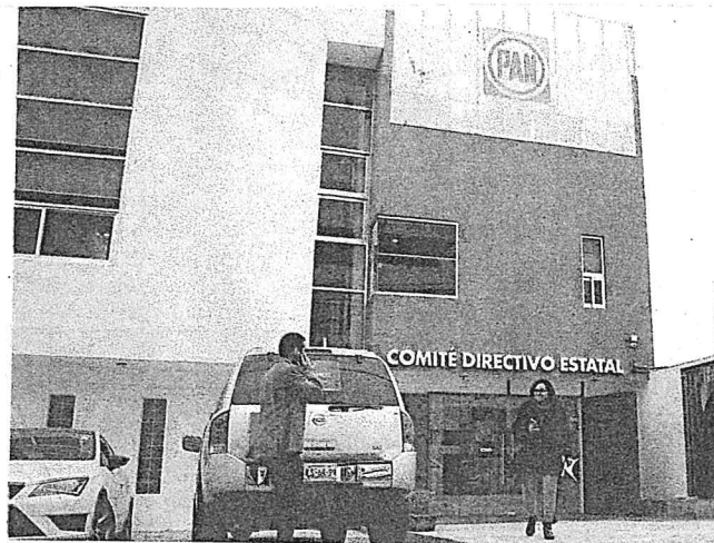
El PAN solicitará al IEEQ sanciones para el PRI, por las denuncias frívolas.