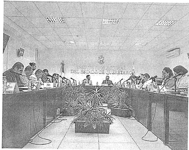
Resuelve IEEQ denuncias presentadas.