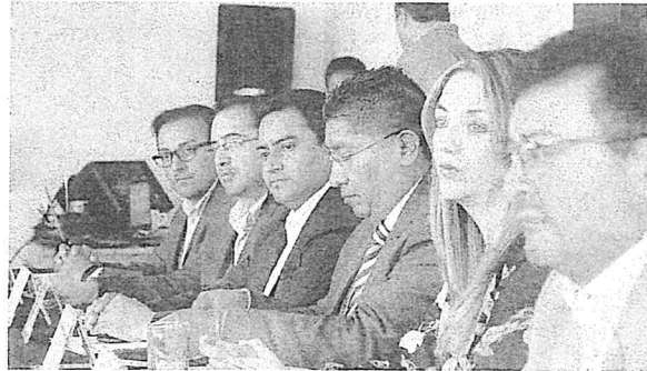
El IEEQ llevó a cabo la Primera Reunión Regional de Innovación y Tecnología Electoral, para intercambiar conocimiento y experiencias.

Destacó que el instituto promueve nuevas tecnologías mediante programas permanentes como Votoqro y Votomóvil, y durante los procesos electorales, a través de Portavoz, Conoce a tu Candidato (a), y el Programa de Resultados Electorales Preliminares (PREP), que en 2018 se posicionó como el tercero más rápido a nivel nacional.