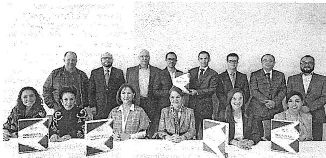
Algunos temas contenidos en las iniciativas son la paridad de género, la cuota indígena, las candidaturas independientes y la votación de la ciudadanía que reside en el exterior, entre otros.